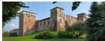
Romano di Lombardia