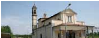
Cividate al Piano