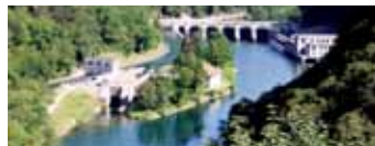
Parco Adda Nord