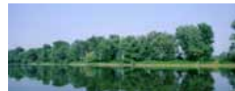
Parco Adda Sud