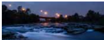
Parco del Serio