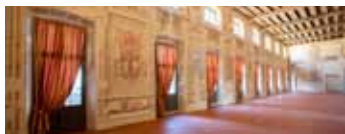
Brignano Gera d'Adda