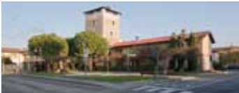
Orio al Serio