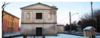
Misano Gera d'Adda